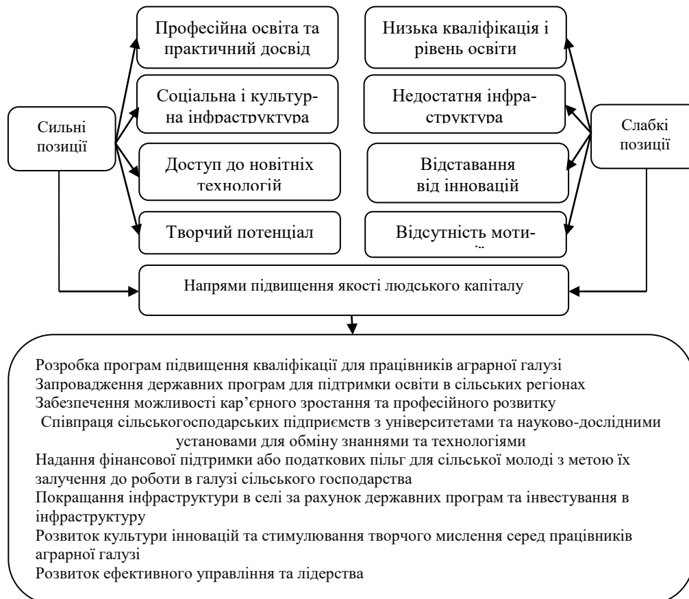
Рис. 1. Напрями підвищення якості людського капіталу аграрної галузі

Для покращання потенціалу людського капіталу в аграрному секторі варто проаналізувати сильні та слабкі його позиції визначити напрями підвищення якості людського капіталу (рис. 1).