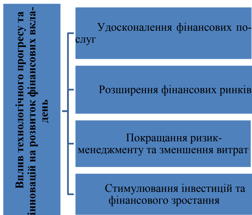
Рис. 2. Основні напрями впливу технологічного прогресу та інновацій на розвиток фінансових вкладень*

Джерело: складено авторами на основі [5]